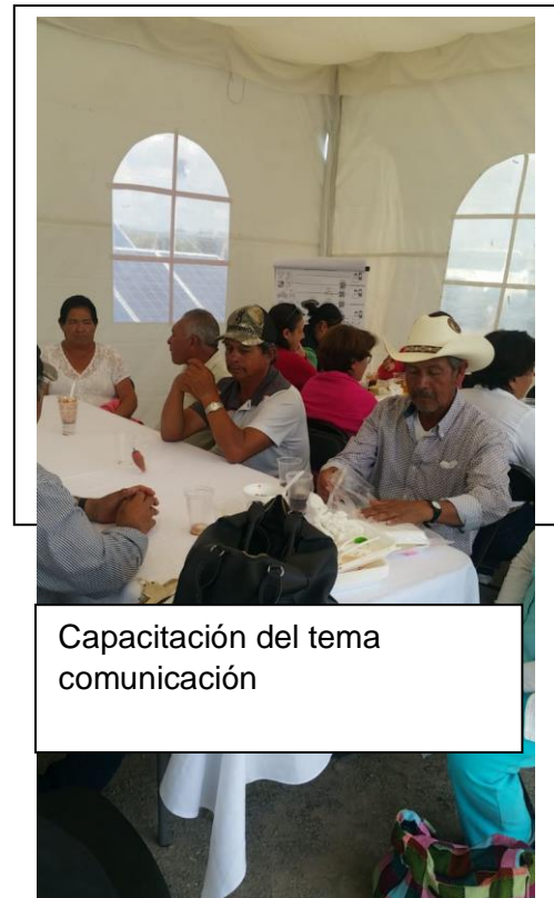
Capacitación del tema comunicación