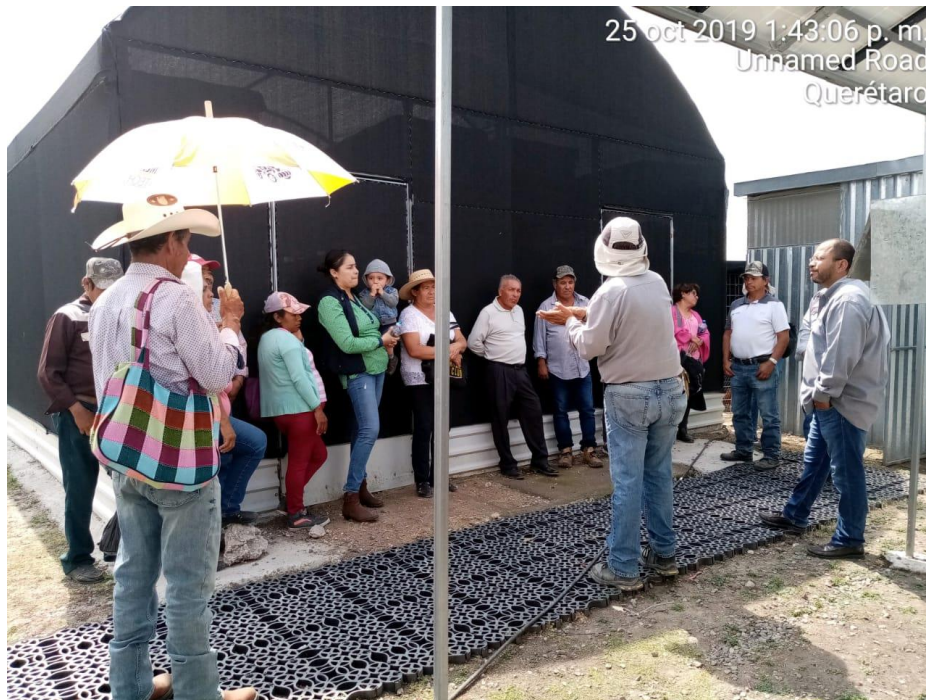
Visitas y capacitación en el centro experimental, capacitación de especialistas de la empresa