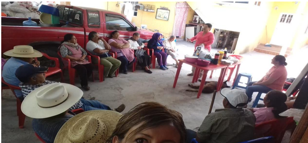
Reunión con campesinas en la comunidad de Charco Blanco