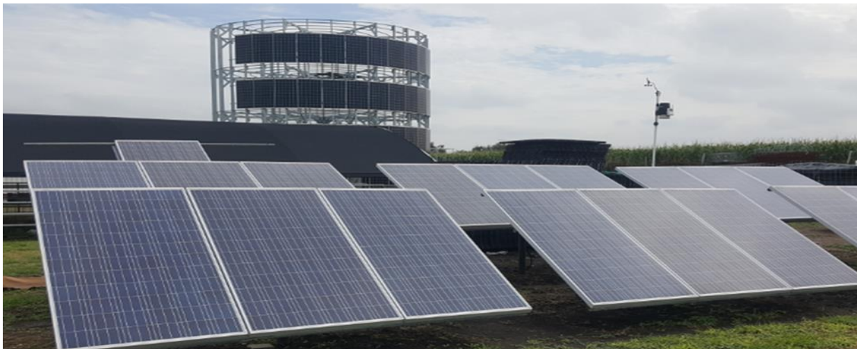
Fotografía sacada con celular.

Centro de investigación, experimental y producción de productos de la empresa IDGREEN S.A. de C.V.