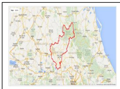
Estado de Querétaro