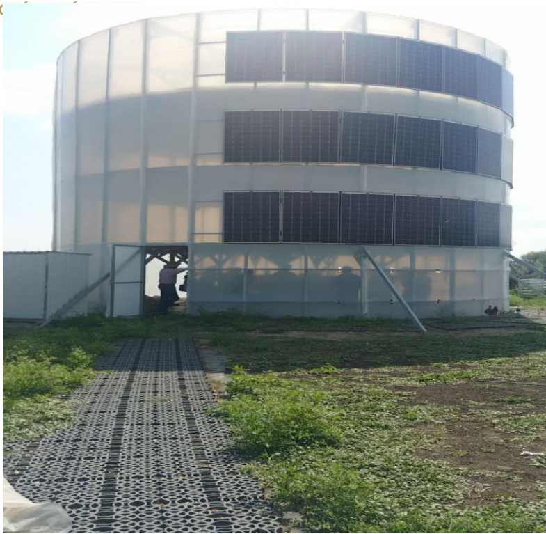
Torre de alimentos