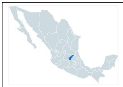
Ubicación respecto a la republica

El proyecto se realiza en el municipio de Corregidora, del estado de Queretaro, en la comunidad del Romeral, donde se ubica la empresa.